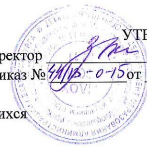
ГРАФИК проведения мероприятий по оценке качества подготовки обучающихся и реализации образовательных программ в MAOU СОШ №11 2 полугодие 2023-2024 уч. года