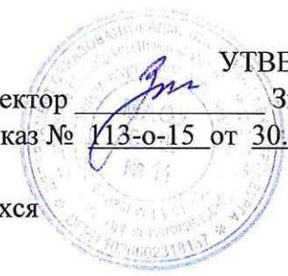
ГРАФИК проведения мероприятий по оценке качества подготовки обучающихся и реализации образовательных программ в МАОУ СОШ №11 1 полугодие 2024-2025 уч. года